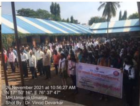
26 November 2021 at 10:58:27 AM N 17° 50' 16", E 76° 37' 47" MH,Umarga,Umarga