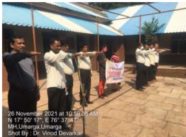
26 November 2021 at 10:59:08 AM N 17° 50' 17", E 76° 37' 47" MH,Umarga,Umarga