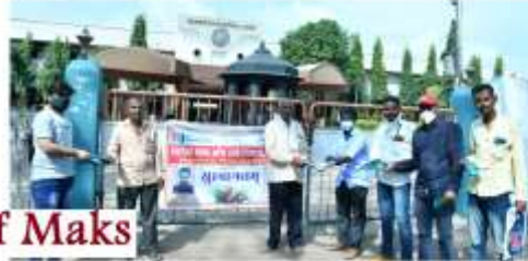
Food package distributed