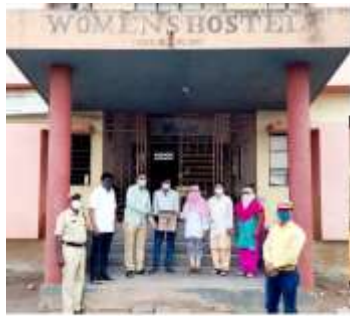
College covid CARE Centre