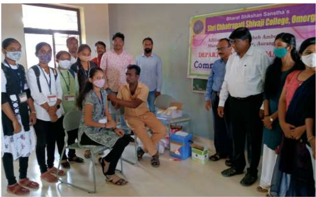
Vaccination Camp for Girls at our college

The college always believed in equality of all cultures and traditions as is evident from the fact that students belonging to different caste, religions, regions are studying without any discrimination. The college is situated at the borders of Karnataka, Maharashtra because of which students come from diverse socio-cultural and linguistic backgrounds. The college organizes annual gatherings. NSS and NCC Units of our college participate in various programs and activities related to social issues organized by the regional government and non-government agencies other than the college. The third-year undergraduate students of B.A. and B.Sc. are required to complete the project which provides an opportunity to the students to work on various scientific, regional, linguistic, communal socio-economic, and other diversity issues.