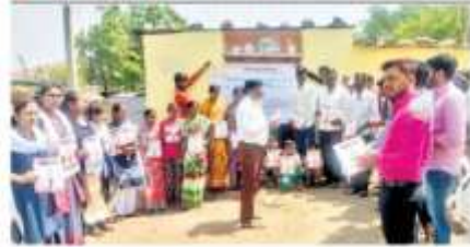
भारतात शिक्षण सर्वोन्नतिकांन घेतली शिक्षण महाविद्यालयाने घेतले हा उपक्रम सर्वोन्नतिकांन वेगळे वेगळे गावांमध्ये (दि.६) लागू करतात धाकटीवाडी, वेगळे वेगळे गावांमध्ये (दि.६) उपक्रम घेण्यात आले.